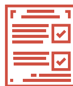
Carta de confirmación de datos.